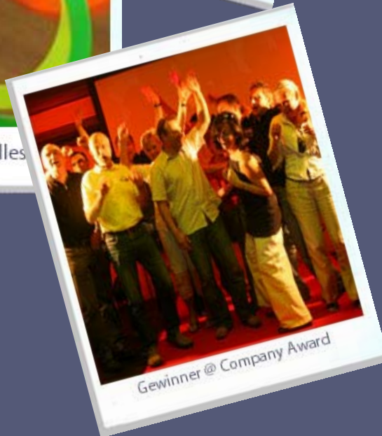
Gewinner @ Company Award