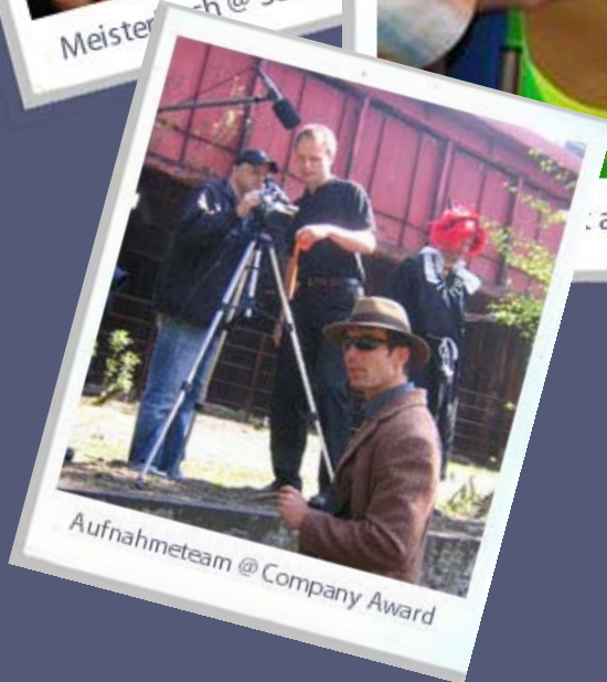
Aufnahmeteam @ Company Award