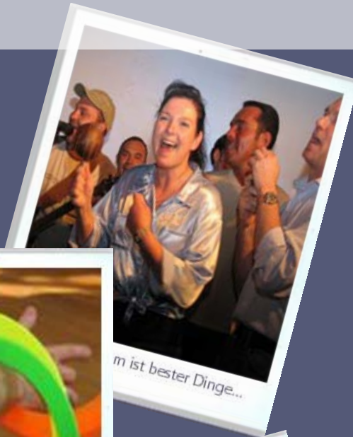
m ist bester Dinge...