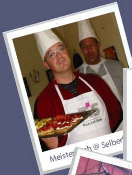
Meisterkoch @ Selber